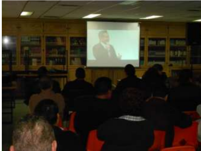
INICIO DE CONFERENCIA