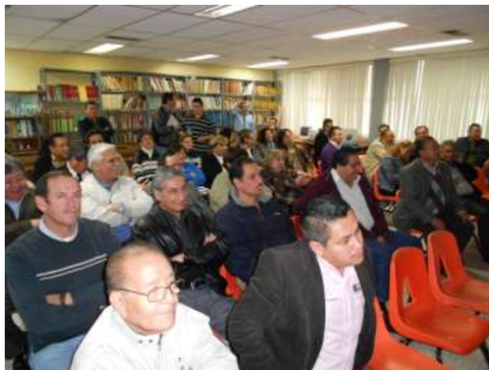
ASISTENTES A CONFERENCIA